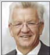
Winfried Kretschmann Ministerpräsident von Baden- Württemberg