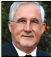
Dr. Gebhard Fürst Bischof der Diözese Rottenburg- Stuttgart