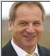
Reinhold Gall Innenminister Baden-Württemberg